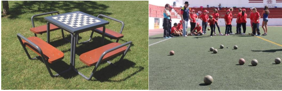
Mesas con tablero de ajedrez o damas y pista para petanca