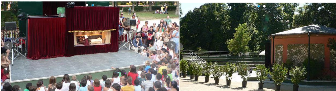
Teatro de Títeres de El Retiro (prioritario)