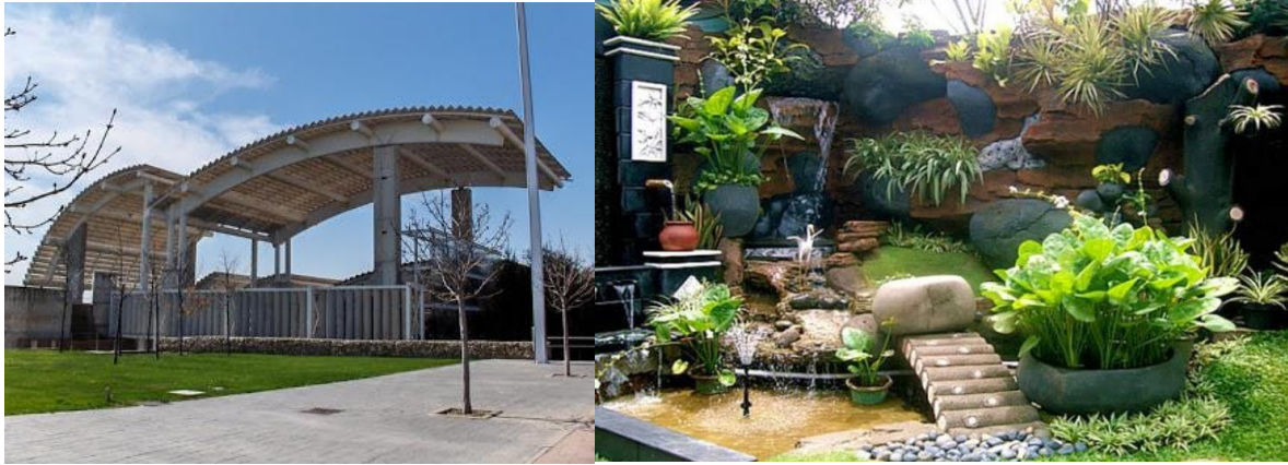
Estufa fría del Parque Juan Carlos I de Madrid y espacio Zen con cascada