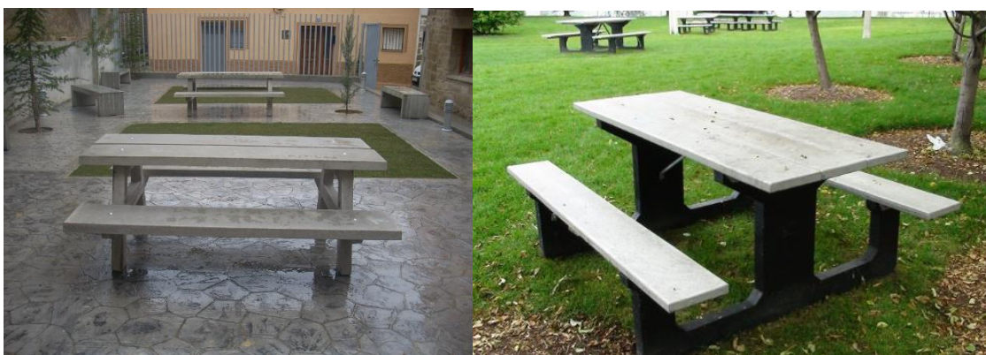
Mesas y bancos corridos resistentes a la intemperie

Además sugieren la posibilidad de instalar un chiringuito polivalente con chuches y refrescos todo el año. En verano con helados; en invierno con churros; en otoño con castañas y en primavera con patatas.