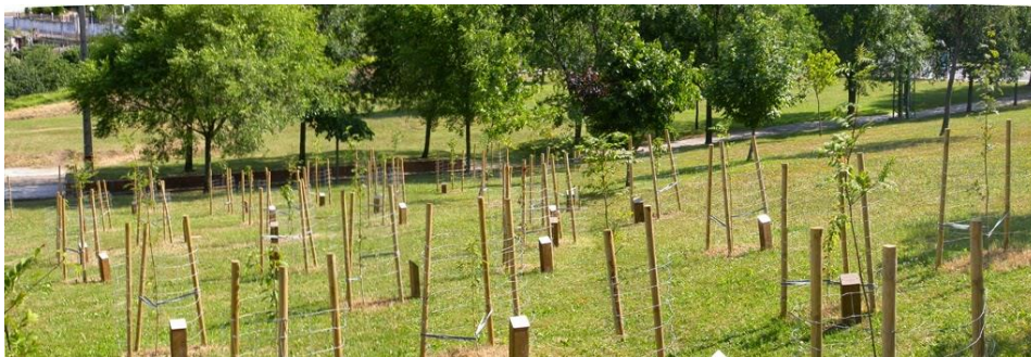
Bosque de la Infancia en Gallarta (Abanto-Zierbena), aspecto tras su plantación en 2006

Sería un arboreto de fácil mantenimiento cuyo cuidado podría incorporarse junto con el del huerto comunitario. Se solicitaría al ayuntamiento acceso a punto de agua y mantenimiento primaveral en forma de cortar la maleza de los alrededores para evitar incendios.