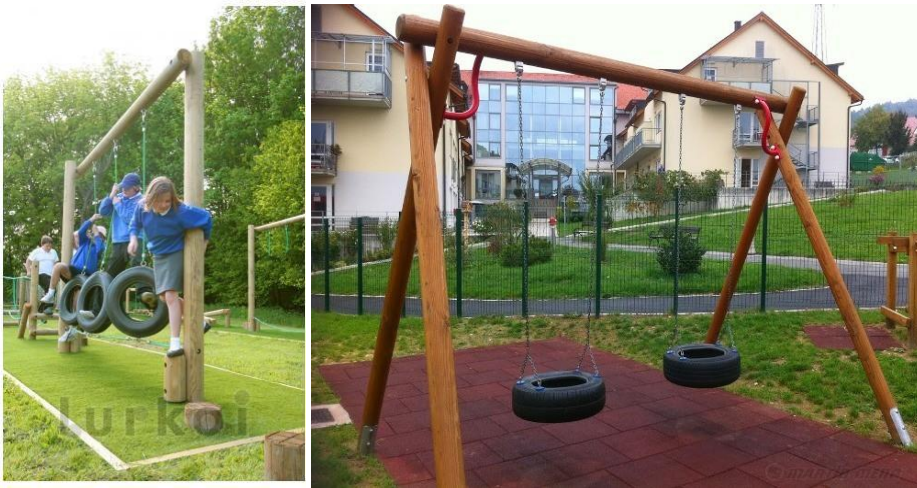
Columpios y juegos con ruedas recicladas

Este espacio es importante para la convivencia de todos los vecinos de todas las edades del barrio se ubicaría al este del predio frente al club de fútbol. Para contribuir a su sostenibilidad se podría mentalizar al vecindario para que todos colaboraran en su mantenimiento (cuidado y limpieza) de modo que entre todos pudieran gestionarlo.