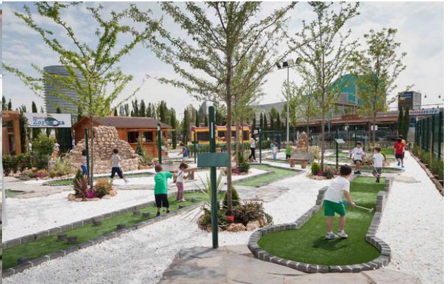
Mini-rocódromo con barras y mini-golf del parque el Agua en Zaragoza