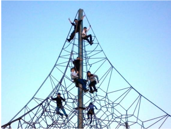
Imagen de “tela de araña” en parque infantil