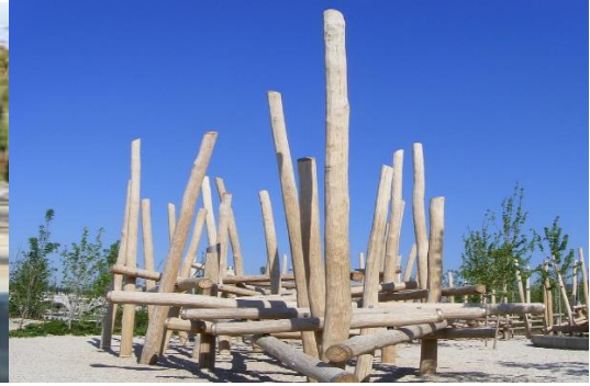
Imágenes de zona para parcour en Madrid Río