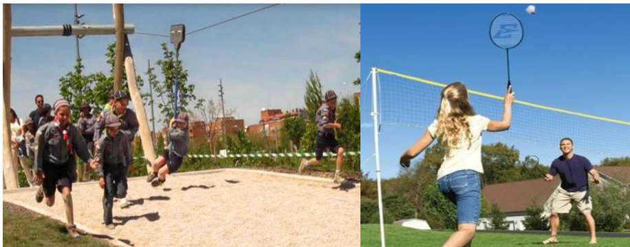
Tirolina en Madrid Rio y pista de badminton/volley al aire libre