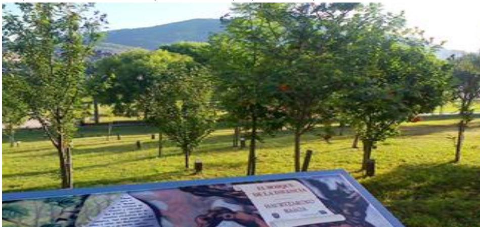
Bosque de la Infancia en Gallarta (Abanto-Zierbena), aspecto en julio de 2012