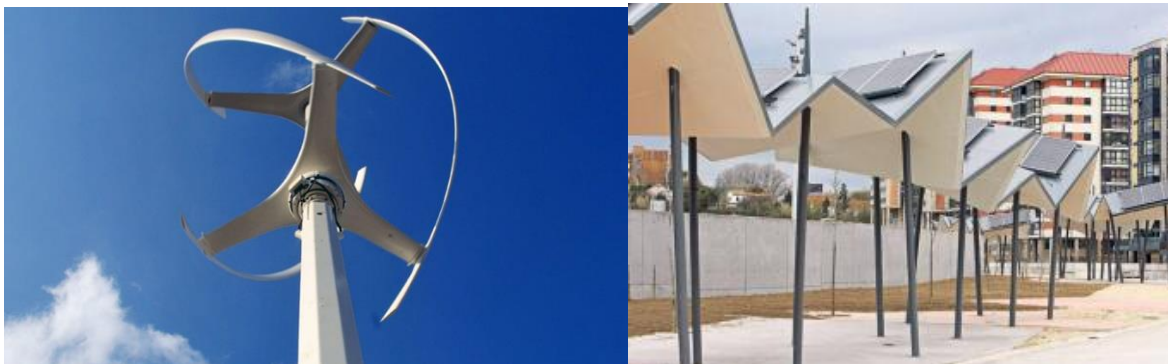
Aerogenerador y pérgolas con paneles solares en el parque de Navia en Vigo

Queremos que sea un espacio autogestionado por una comisión de la Asociación Vecinal sin depender de Unión Fenosa ni del Canal Isabel II para que sea más económico y ecológico.